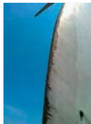
Rimpimento e riparazione della pala rotta nella zona erosa perimetrale