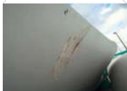
Finitura superficiale finale di scalfitture o graffi